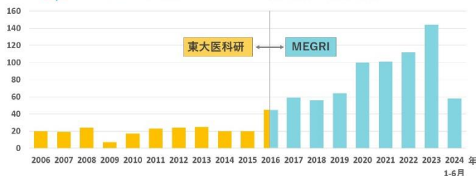
MEGRI 医療ガバナンス研究所 論文数

国内でも、福島県(福島県立医大など)、広島県(エムネス)、鹿児島県(よしのぶクリニック)、福井県(オレンジホームケアクリニック)などの医療機関・研究所と共同研究を進めています。